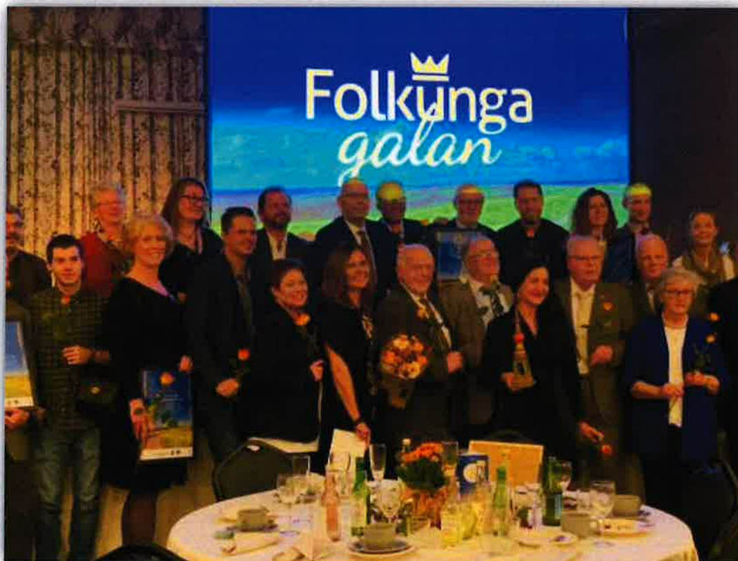
Folkungagala den 17 oktober 2019 på Bygdegården Klippan i Vånga med nominerade och prisutdelare

Tillsammans med Astrid Lindgrens Hembygd och Kustlandet genomfördes en undersökning om långtidseffekter av projekt genomförda 1996-2013. Undersökningen ledde till ett erfarenhetsutbyte mellan Leaderområdena och har givit styrelseledamöterna och personal ökad kunskap om att tidigare genomförda Leaderprojekts resultat ofta är bestående. I många fall har också de positiva effekterna uppstått efter projektens slut. Att positiva effekter uppstår har att göra med Leadermetodens grundprinciper som samarbete, förankring och långsiktighet.